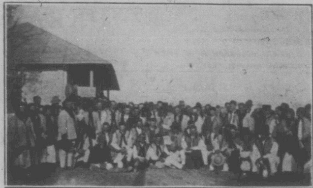
Селіне села Кичке, повіт Ситин, перед росподілом допомоги.