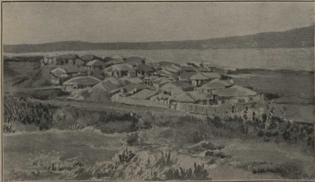
Ensemble de l'aspect de Masampho occupé par les Russes.