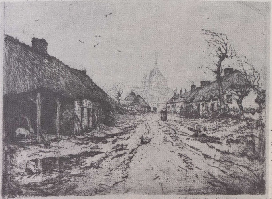
Mont-Saint-Michel, Clarence Gagnon, eau-forte en brun sur japon, vue partielle.

La Galerie nationale présente actuellement, jusqu'au 14 juin, une rétrospective de l'art des graveurs canadiens entre 1556 et 1963. Les oeuvres présentées sont tirées des deux collections d'estampes les plus importantes du Canada, celle de la Galerie et celle des Archives publiques du Canada.