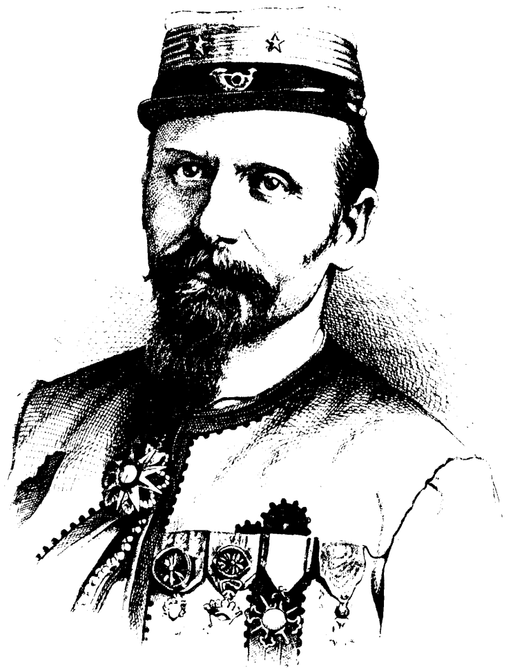
LE GÉNÉRAL BARON DE CHARETTE