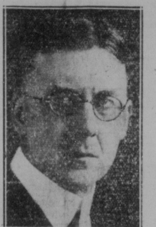
J. E. Brownlee, premiärminister.

Tardieu har givit order därom. Tyskland har nu uppfyllt sina äligganden. Konseljpresidenten Tardieu har givit order om Rhenlandets om- delbara utrymning, sedan skade- ständskommisionen konstaterat att Tyskland uppfyllt sina älig- ganden.