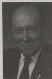
Arthur Tremblay, sénateur Progressiste conservateur Les Laurentides (Québec)