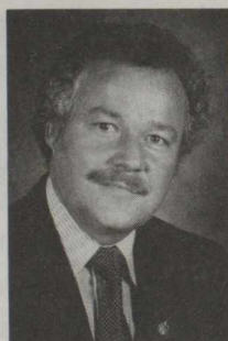
Marcel Roy, député Libéral Laval (Québec)