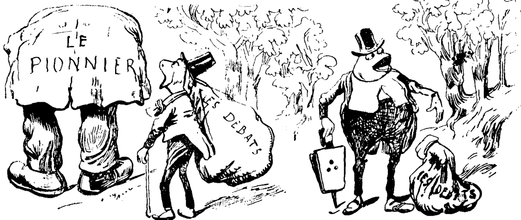
Une grenouille vit un bœuf Qui lui sembla de belle taille.

LA GRENOUILLE QUI VEUT SE FAIRE AUSSI GROSSE QU'UN BŒUF