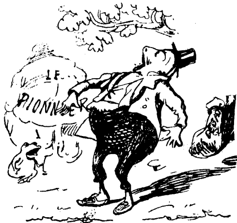
Disant, regardez bien, ma sœur. Est-ce assez ? dites-moi, n'y suis-je point encore ?