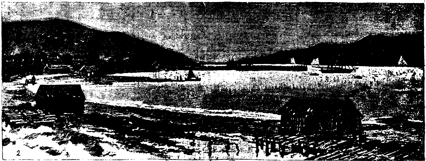
1. SAISIE DE LA GOELETTE "ADAMS."