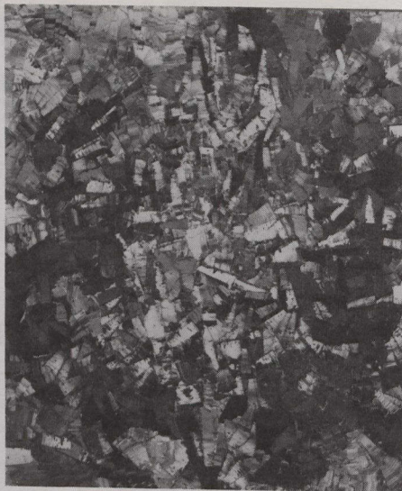
Jean-Paul Riopelle, La roue II , 1956.