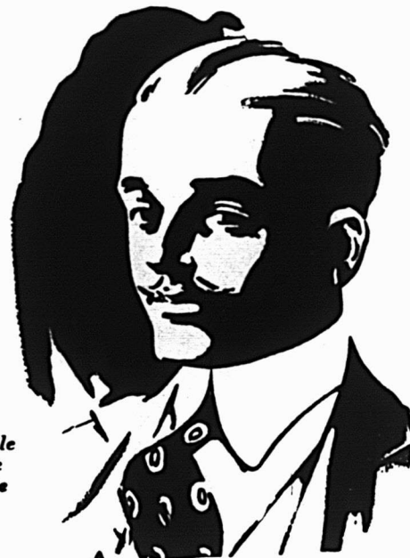
Nouvelle forme ajustée