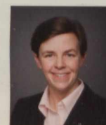
L'honorable D re K. Kellie Leitch Ministre du Travail Ministre de la Condition féminine