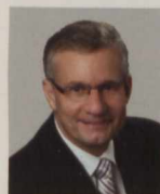
L'honorable Ed Fast Ministre du Commerce international