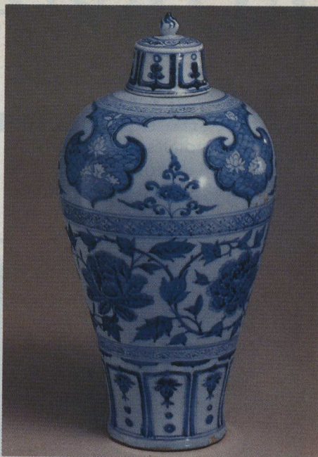
Vase balustre, meiping , de l'époque des Yuan.

L'exposition égyptienne était aussi une idée originale de M. Drapeau qui avait alors créé une première en Amérique. Elle a été inaugurée à Montréal, où plus de 700 000 personnes l'ont admirée, et a été montée