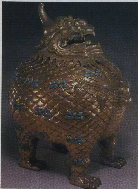
Monstre cornu en bronze doré et turquoise.

Chine : trésors et splendeurs , que l'ambassadeur Yu Zhan de la République populaire de Chine qualifie de plus grande exposition d'objets précieux qui aient jamais quitté son pays, est présentée en exclusivité au Palais de la Civilisation de Montréal.