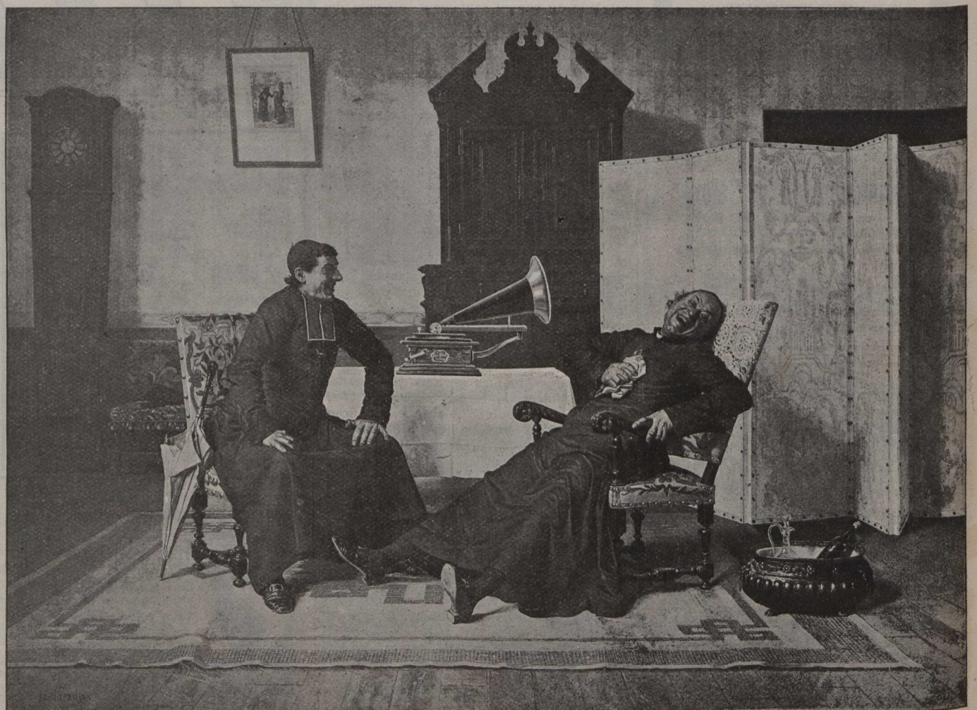
Nous reproduisons ci-haut une photographie d'une lithographie que la Berliner Gramophone Co., du Canada, 2315 rue Ste Catherine, donne gratuitement à tous ceux qui en feront la demande à leur magasin, durant la saison des fêtes. Cette lithographie sera envoyée à n'importe quelle adresse sur réception de 2 cents pour frais de poste.