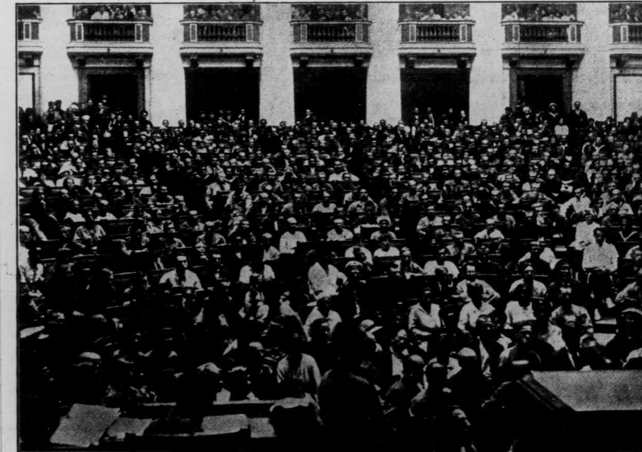
Засіданє Петроградського Совіту Робітничих, Селянських і Червоноарміїських Депутатів.