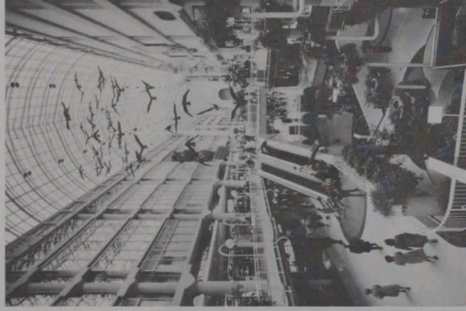
トロントのイトン・センター

市となったトロントは、全般的にみて調和と多様性が象徴的に混在している都市である。全天候型街路のあるイトン・センターが、新しい都市の核として機能しながらも、これと隣接する各街区は、まさに多様な表情を共有している。そして都心部の近くに点在する人間くさい近隣コミュニティも、それぞれ独特の個性を有している。