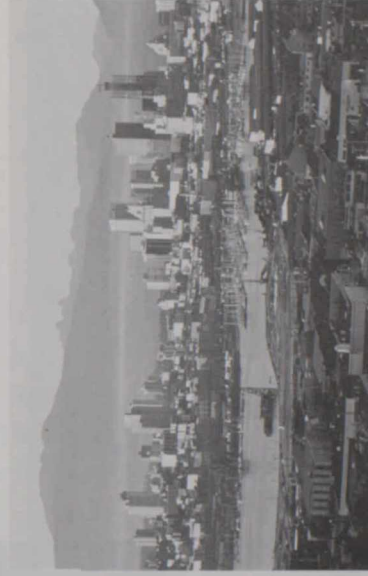
バンクーバー市では入江や水路に接した地区の再開発が課題。

バンクーバー名物のチャイナタウンも再開発の対象となった。一九六〇年代にストラスコッド地区の取り壊し計画が持ち上がったが、住民の反対により市では計画を全面撤回し、代わって「コミュニティ改善開発計画」を発足させた。州政府と連邦政府もこれを援助して、八つの近隣住区の「オーバーホール」が行われた。各区の再生プランは画一でなく住民の意思と地区の条件に応じて、古い建物