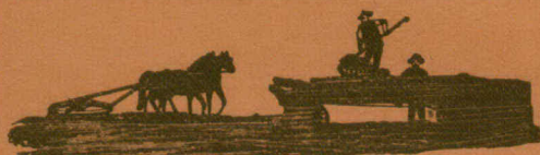
"La Canadienne" Presse à foin en acier et en bois.

Charrues, Herse a ressort Herse a roulette et Se- moir a 8 sections.