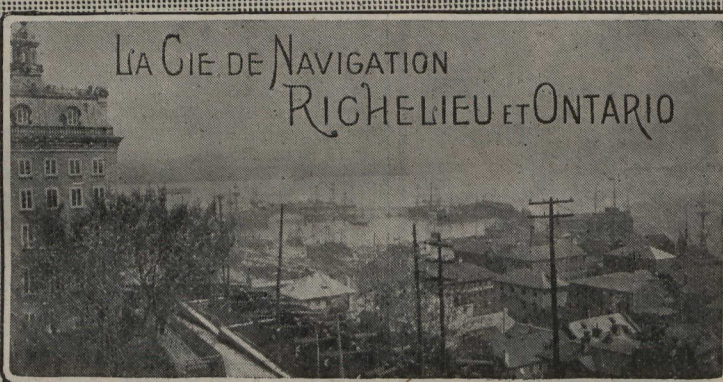
QUEBEC, LE GIBRALTAR DU CANADA