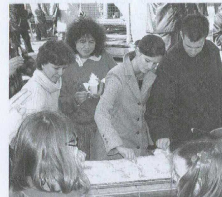
Dégustation de sirop d'érable au kiosque du Canada

kiosque. Ce sont les multiples rencontres et préparatifs faits à Ottawa, à Montréal, à Toronto et, plus récemment, à Vancouver par le Ministère et les ambassades des pays baltes au Canada qui ont permis une participation aussi active.