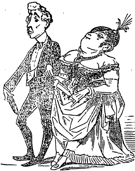
Lui.—Et on appelle cela ma moitié.