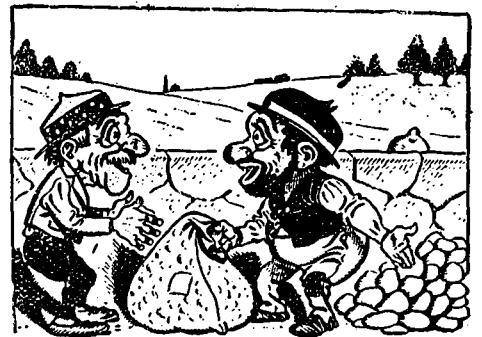
VI — Une bonne farce, dit l'un deux. Tu vois ces cailloux. Nous allons les mettre dans le sac...