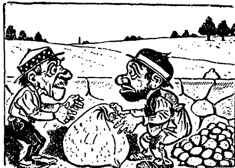
V Enlever le sac fut pour eux l'affaire d'un instant.