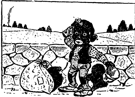
II —Diable ! c'est lourd...