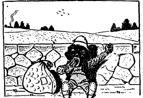
III ... Je n'en puis plus, je vais me reposer un instant.