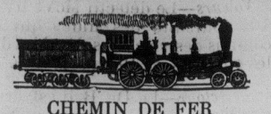
CHEMIN DE FER

AN ELEGANT AND REFRESHING FRUIT LOZENGE for Constipation, Biliousness, Headache, Indigestion, &c. &c. SUPERIOR TO PILLS and all other systems, regulating medicines. THE DOSE IS SMALL. THE ACTION PROMPT. THE TASTE DELICIOUS. Ladies and children like it. Price, 30 cents. Large boxes, 60 cents. SOLD BY ALL DRUGGISTS.