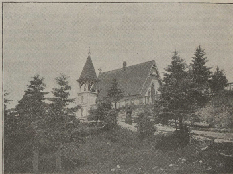
LE CANADA PITTORESQUE — L'église de Grand-Manan, Nouveau-Brunswick.