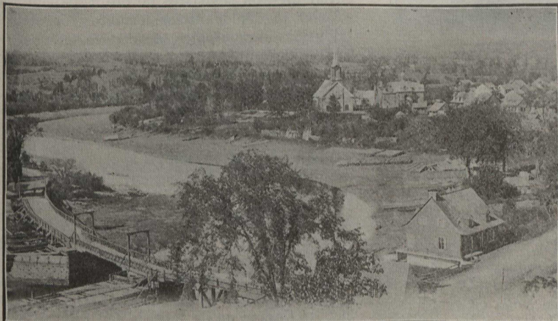
LE CANADA PITTORESQUE . — Le Cap Rouge, près Québec. Vue prise à la tête du pont.