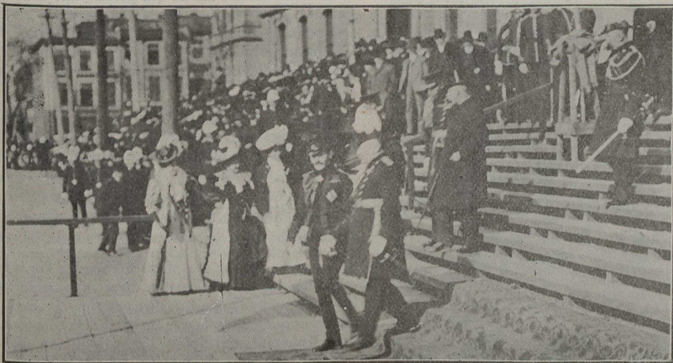
A MONTREAL — S. A. R. le prince Arthur de Connaught, se rendant sur le Champ-de-Mars pour y passer une revue militaire.

Par abonnements: $2.50 par année, $1.25 pour 6 mois, franc de port pour tout le Canada, les États-Unis, l'Alaska, Cuba, le Mexique, les Iles Hawai et les Iles Philippines. Au numéro: 5 cents Pour les autres pays de l'Union Postale: Abonnements: $3.50 par année, ou 18 francs.