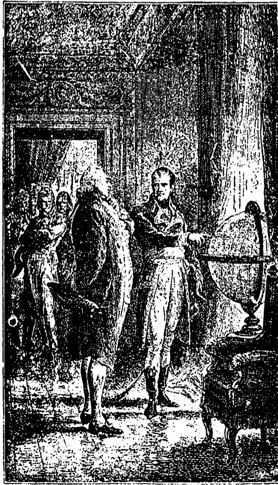
Quel est le personnage représenté dans le Dessin qu'on a sous les yeux ?