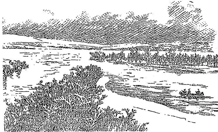
LE PÈRE MARQUETTE ABORDANT À SUMMIT.

Statue en marbre offerte par l'Etat du Wisconsin au gouvernement fédéral des Etats-Unis.