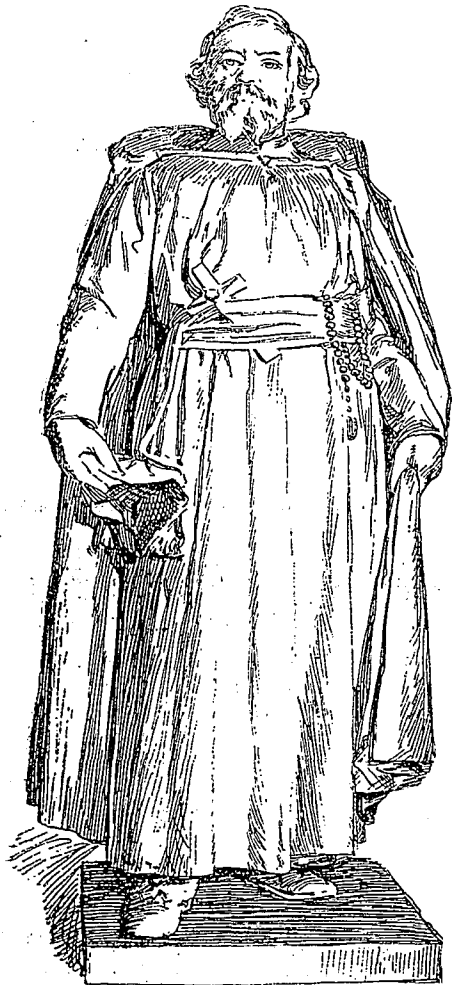
LE PERE MARQUETTE.

Statue en marbre offerte par l'Etat du Wisconsin au gouvernement fédéral des Etats-Unis.