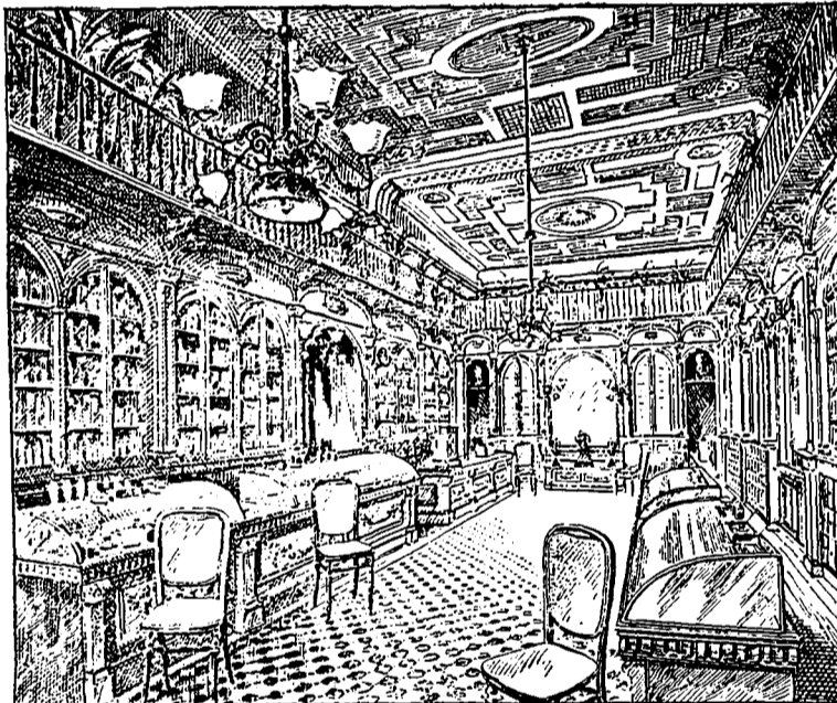
INTERIEUR DE LA PHARMACIE NATIONALE.