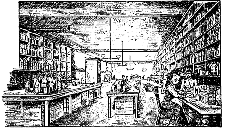
Entrepot des marchandises.

UNE pharmacie "fin-de-siècle" vient de s'ouvrir dans la bâtisse du Monument National, qui est sans contredit la plus belle pharmacie du Canada sinon de l'Amérique. C'est toute une surprise et une révélation. Les comptoirs et fixtures sont en chêne frisé, solide, choisi avec soin, travaillés avec un goût exquis et artistique et ornés ici et là de sculptures de maître. En arrière des tablettes sont de jolis miroirs qui font ressortir les nombreux bocaux en verre coupé étalés avec goût et contenant un assortiment complet de médicaments les plus purs et les plus nouveaux, mais à la portée de toutes les bourses. Trois immenses glaces bizautes donnent à tout l'ensemble un coup d'œil vraiment féérique.