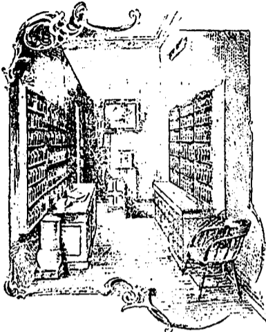
Departement des Prescriptions.

Une profusion de lumières électriques, savamment combinées, font ressortir avec avantage un plafond peint à fresque par notre célèbre artiste canadien, M. Meloche.