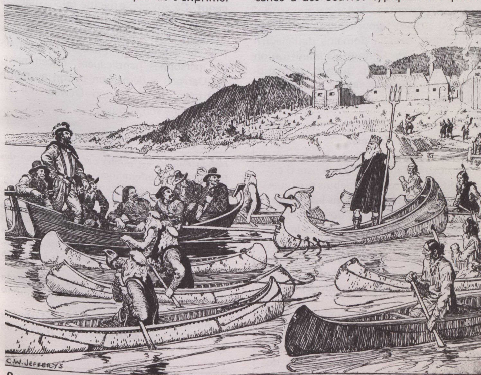
Première pièce de théâtre au Canada. Oeuvre de Charles W. Jefferys; plume et encre. Collection de la division de l'Iconographie des Archives publiques. (C 106968)