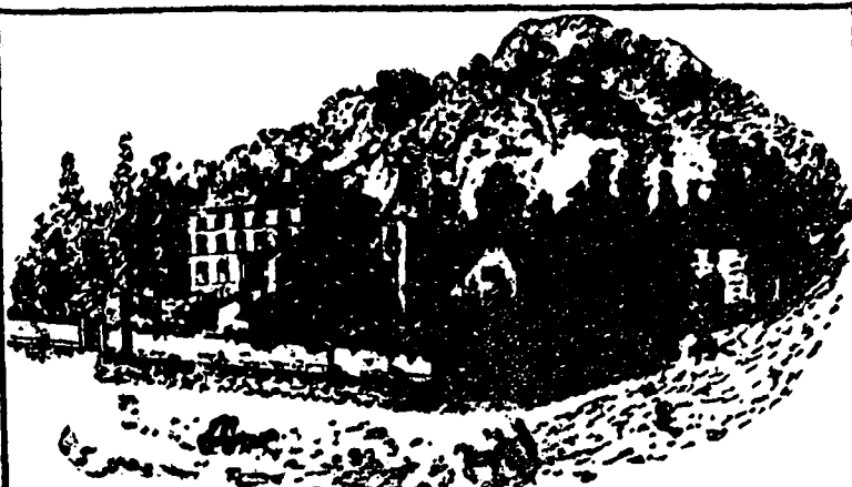
CHATEAU ST MICHEL

M. PLUMITIF (très occupé). — Eh bien, c'est bon, dites-lui qu'il n'en faut pas aujourd'hui.