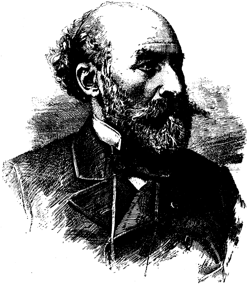
M. OCTAVE FEUILLET, DE L'ACADÉMIE FRANÇAISE

Tarif spécial pour annonces à long terme