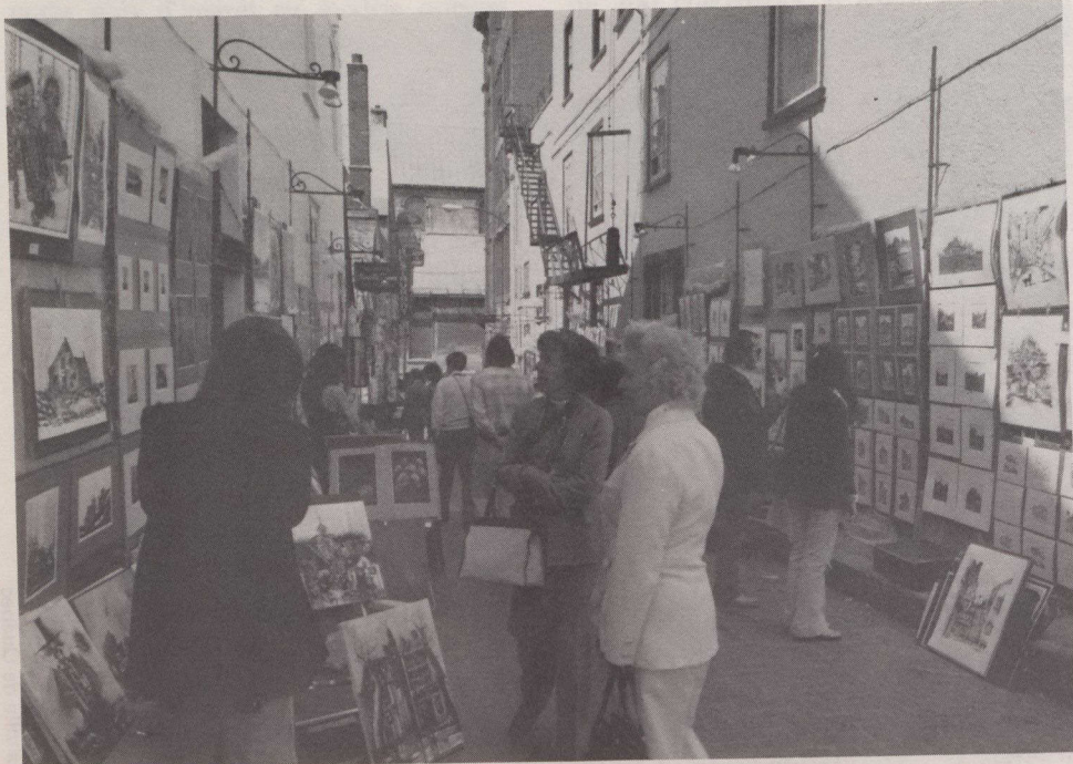
La rue du Trésor : lieu artistique très fréquenté.

Au programme de la soirée d'ouverture de cette année, on pouvait assister à un concert de l'Orchestre symphonique de Montréal, dirigé par Charles Dutoit, dans les Jardins de l'hôtel de ville, des spectacles de Robert Charlebois et de Léo