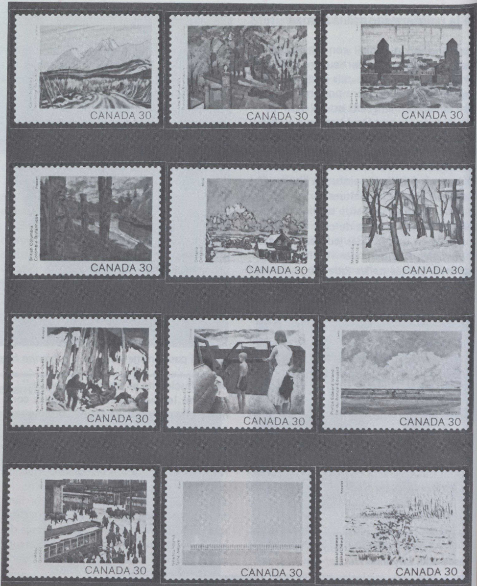
La Société canadienne des postes a émis un feuillet commémoratif de 12 timbres à l'occasion de la fête du Canada 1982. Le feuillet reproduit 12 tableaux d'artistes illustrant chacun une scène caractéristique de la province ou du territoire représenté.