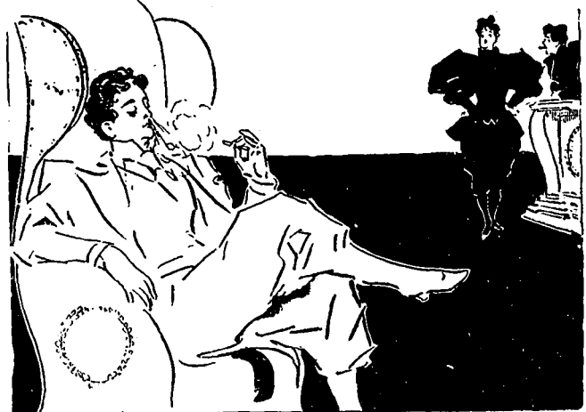
Le dernier chic au club Sorosis, à New-York.