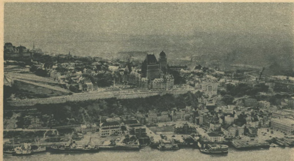
Québec, capitale du Canada français.

Les "Loyalistes" de même que les colons américains qui vinrent par la suite au Canada, épris de liberté, désiraient un gouvernement représentatif. L'Acte constitutionnel de 1791 répondit à cette aspiration en établissant des assemblées populaires. Le Canada fut partagé en deux provinces, le Haut et le Bas-Canada, que séparait la rivière Ottawa. On dota chaque province d'une assemblée législative élue. Bien que les gouverneurs provinciaux, entourés d'un conseil exécutif qu'ils choisissaient eux-mêmes, fussent encore les maîtres, on avait fait un premier pas vers un gouvernement démocratique.