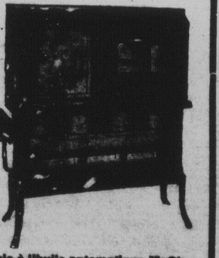
Chaudière Automatique McClary, pour l'eau.

Grand Assortiment d'Appareils Electriques modernes. Vous êtes cordialement invités à visiter nos accessoires Electriques etc., nos prix sont les plus bas. Grille pain Electrique $4.50 à 6.50. Fer à repasser Electrique $4.00 et 5.50. Evantails Electriques de $12.50 et plus. Poêle de cuisine Electrique, Vibrateurs à message Electrique. Aussi nous avons un très belle assortiment de glacières nouveaux modèles. Assortiment complet de poêles à l'huile de deux, trois, et quatre feux. Boyeux pour arrosage en caoutchouc cordé de première qualité 1/2 pc. 18c. par pied 1/4 pc. 20c. par pied.