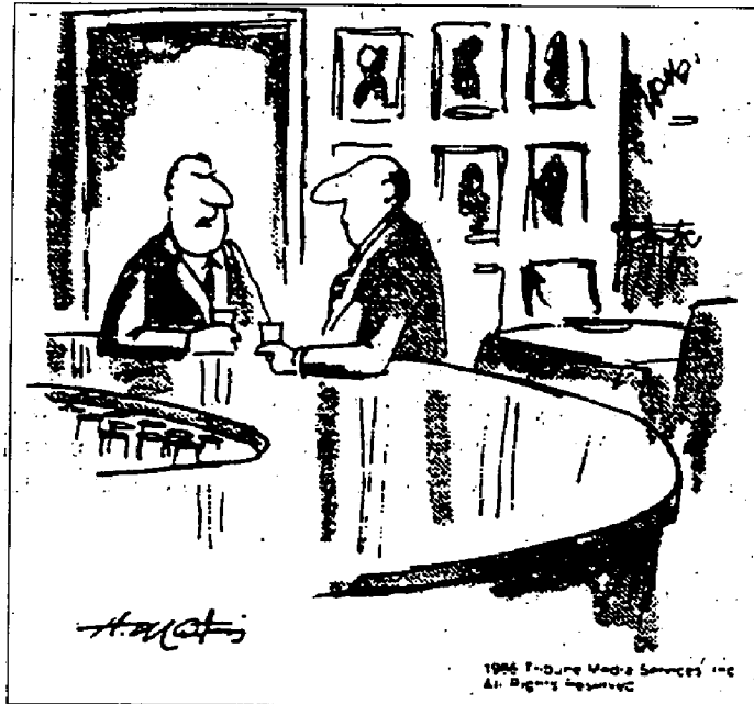
"I don't mind being an employee, but I dislike becoming personnel and I'll be damned if I'm going to be a human resource."

« Ça ne me fait rien d'être un « employé », mais je n'aime pas être « du personnel » et il n'est pas question que je devienne une « ressource humaine ».