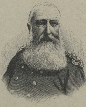
S. M. Léopold II, roi des Belges, que l'on dit être assez gravement malade.