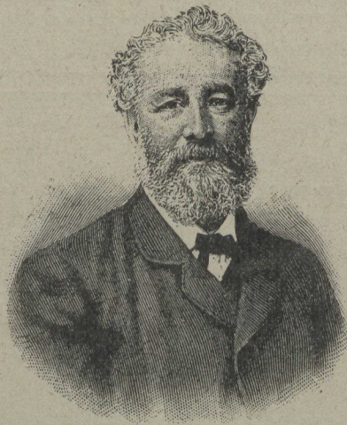
Le fameux romancier Jules Verne, à qui l'on vient d'élever une statue dans son pays natal.