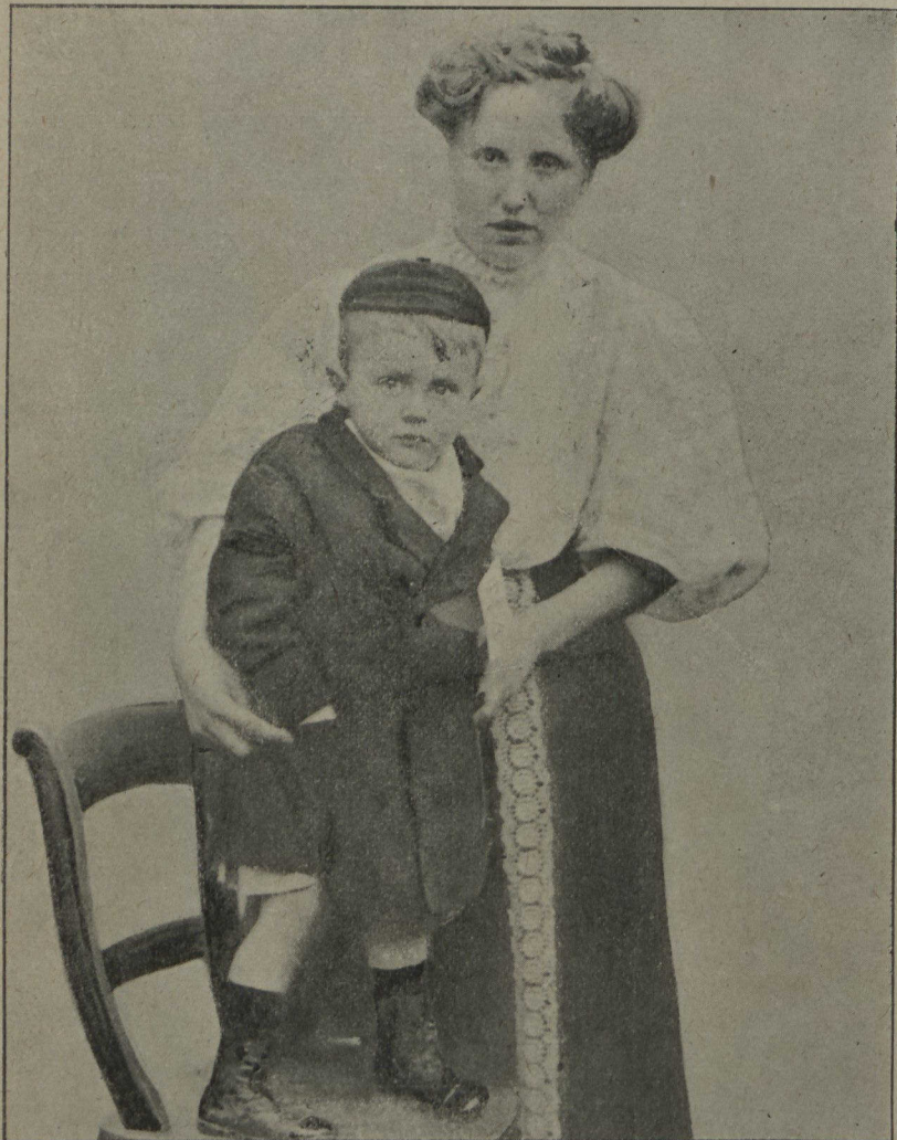
PETIT AMERICAIN — Le garçonnet que représente notre gravure (il a 3 ans) né à St Louis, Missouri, E. U., a donné récemment une preuve de l'énergie des jeunes américains, en traversant seul l'Atlantique, pour aller rejoindre sa marraine en Ecosse. Le pauvre petit ayant perdu sa mère, son père, sans moyens, décida de l'envoyer en Ecosse, et l'enfant s'y rendit... comme un homme.