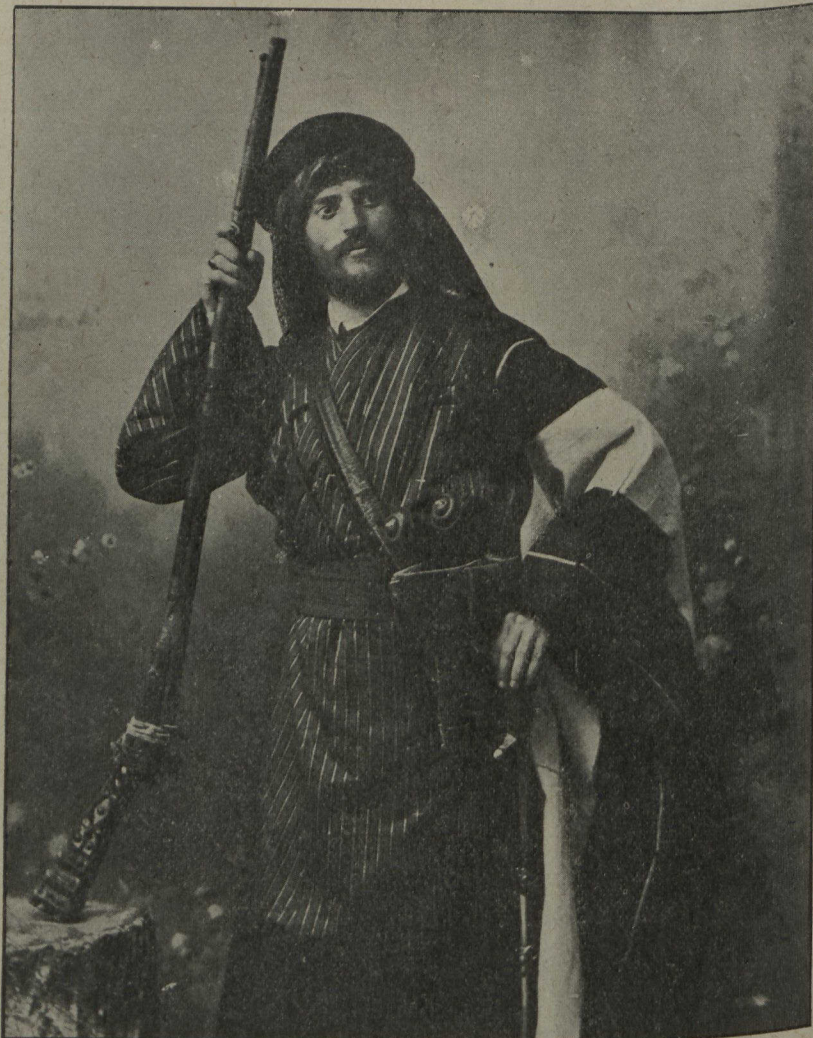
EN AFRIQUE NORD — Type de Bédouin, prêt à prendre les armes, si la guerre sainte éclatait au pays de l'Islam, comme on le redoute en ce moment. Déjà les choses se gâtent au Maroc, au point de nécessiter la présence d'une flotte anglo-française à Tanger.