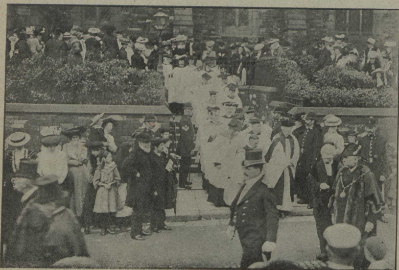
EN ANGLETERRE — Congrès de l'église anglicane à Barrow. En tête de la procession qui quitte l'église St Georges, on voit l'archevêque anglican d'York. Ce congrès, par les résolutions qui y furent prises, a eu un grand retentissement dans le Royaume-Uni.