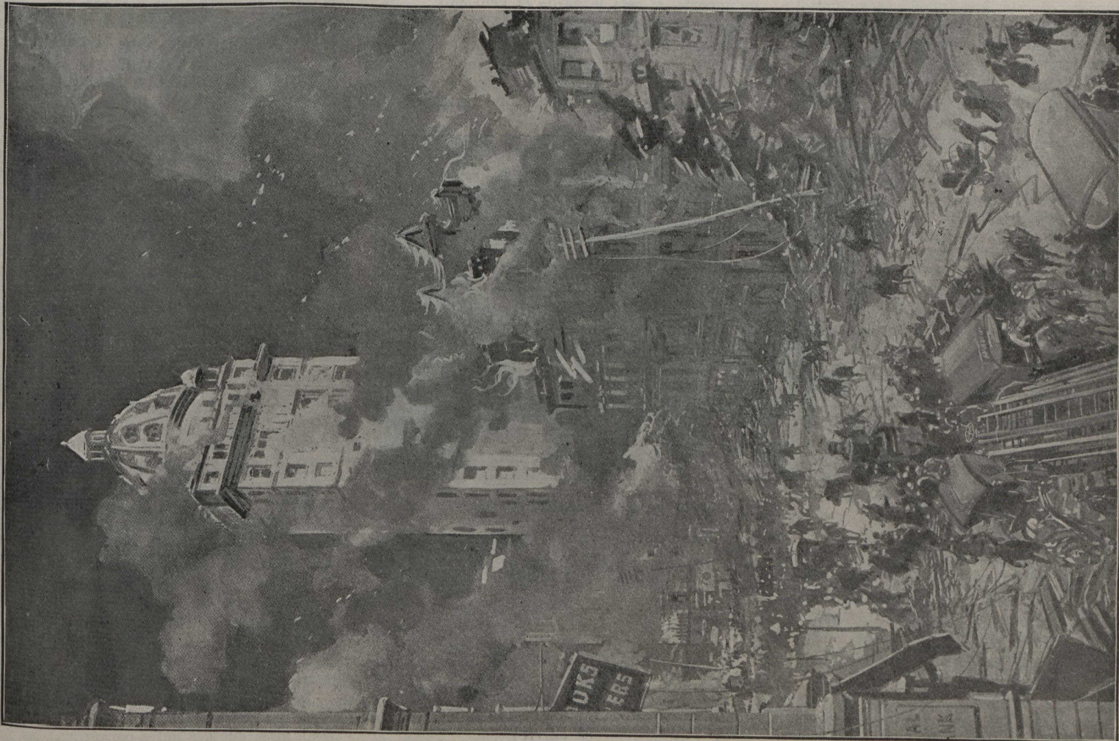
La destruction du quartier des affaires de San Francisco.