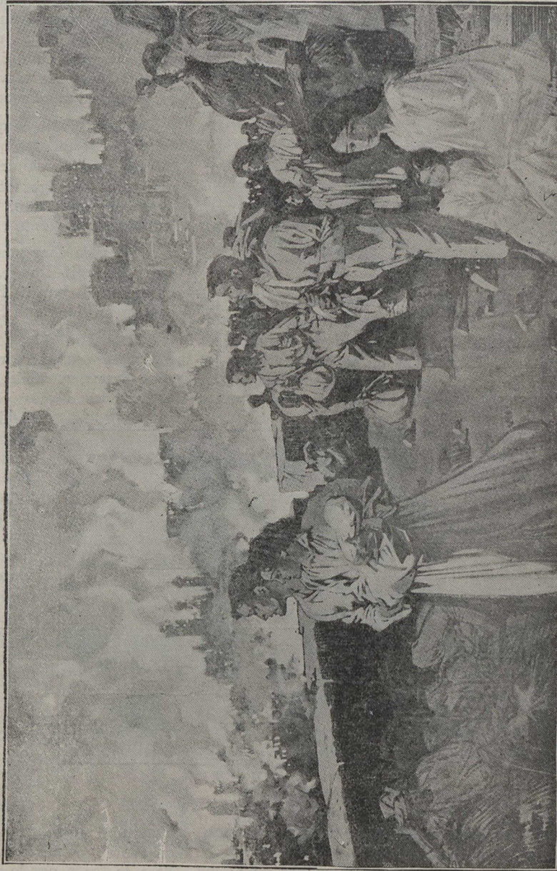
Les sinistrés de San Francisco, fuyant de la ville incendiée par le tremblement de terre, le 18 avril 1906.