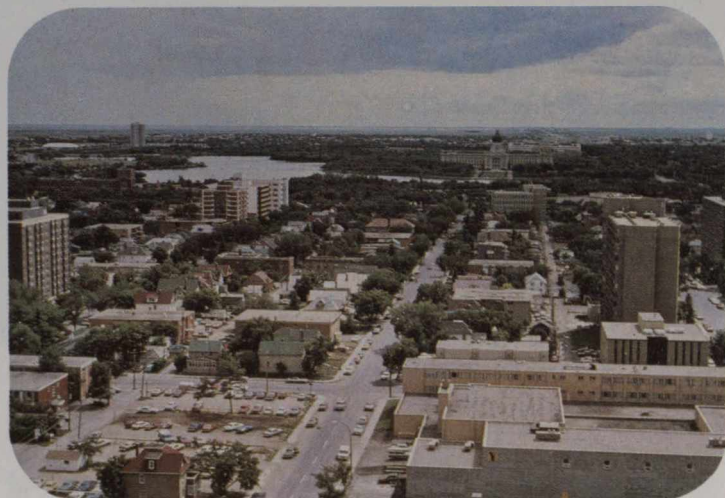
Panorámica de Regina, capital de la provincia.

En 1872, el Gobierno Canadiense ofreció tierra gratis a quien la quisiese, y atraídas por esta oferta, vinieron personas de todo el mundo a la provincia. Con ellas vino la ley, la Policía Montada del Noroeste, y cuando se instituyó la ley, llegaron más colonizadores.