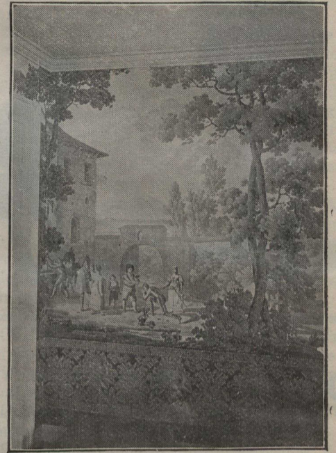
Tapiserie représentant une scène de don Quichotte, trouvée dans une vieille maison de Salem.

travail ou une bibliothèque, des scènes de chasse ou de course ou de golf, ou encore des reproductions de tapisseries de Smyrne sont parfaites. D'autres papiers pour bibliothèque sont à effets de verrière et les nuances sont aussi variées que