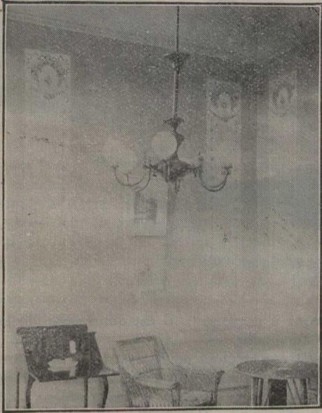
Pour le salon de réception.

Rien ne semble plus difficile à choisir que le papier à tenture. Aussi que de rouleaux ne fait-on