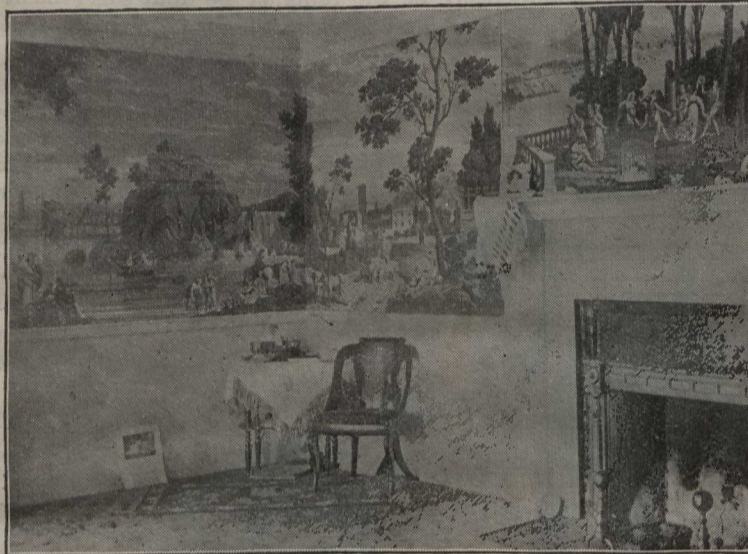
Une pièce de la maison de l'ex-président Pierce, à Hillsborough, N. H. — Paysages et scènes diverses.

On obtient en combinant artistement les couleurs, une multitude d'effets imitant les styles vénitiens, hollandais, turcs, etc. Comme ces tentures sont généralement peintes sur commande les propriétaires choisissent l'ameublement de la pièce dans le même style. Rien n'est plus joli que l'uniformité de style dans la décoration d'une pièce. Par exemple une chambre Louis XVI sera tapissée de papier délicatement teinté avec un motif de fleurs qui se retrouvera sur le brocart des fauteuils et des divans. Ce genre conviendrait particulièrement bien à un boudoir. Dans quelques très vieilles habitations de la Nouvelle-Angleterre on retrouve encore des tentures où sont représentés des paysages, des rivières, des arbres, des maisons sur un fond de ciel bleu. Il ne reste plus aujourd'hui que de rares spécimens de ces tentures. Il en existe un à "Cherry Valley" dans l'état de New-York