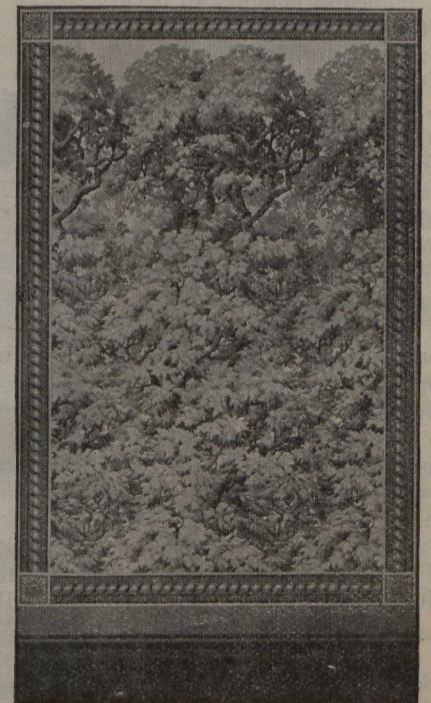
Effet de ciel et de forêt pour l'anti-chambre.