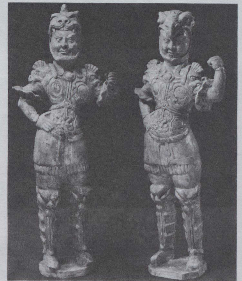
Guerriers de barro esmaltado de verde, con trazos de pigmento, de procedencia China (Siglo VII)

De todos los artículos apilados sobre los lomos de los camellos o colocados en las bodegas de los barcos que cruzaban los mares tenebrosos, el más famoso era la seda, "el material más noble de todos los materiales, el tejido de los reyes". Los chinos descubrieron hace más de 4.000 años el cultivo de la seda mediante la explotación del gusano de seda y el hilado