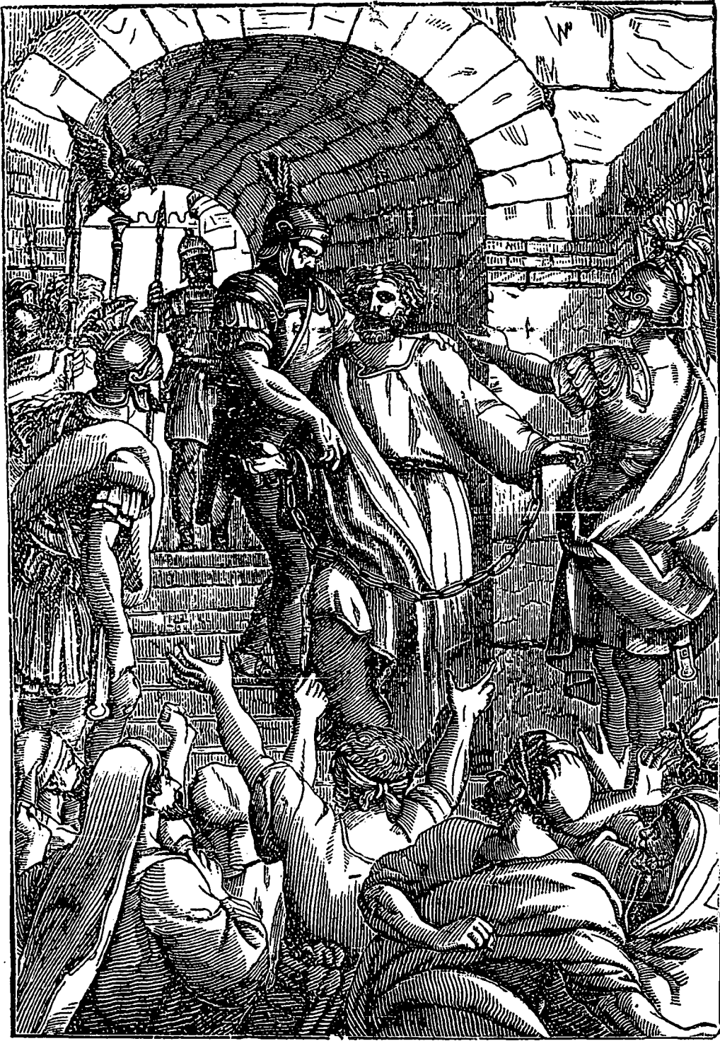
PAUL LE PRISONNIER.

La crèche salutiste, ou nursery , est consacrée à ces pauvres petits