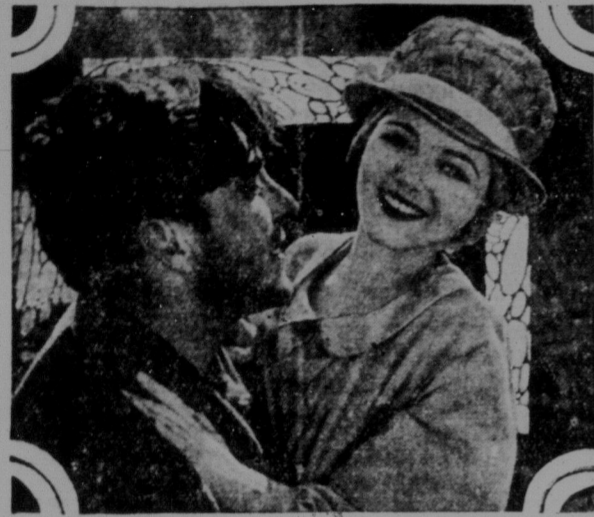
George O'Brien and Janet Gaynor in Sunrise Fox Picture

В ПЯТНИЦЮ, 8. ЛИСТОПАДА, ВІД ГОД. 8.30 ВЕЧЕРОМ В СУБОТУ, 9. ЛИСТОПАДА, ВІД ГОД. 7-01 ВЕЧЕРОМ В УКР. РОБІТНИЧИХ ДОМАХ У ВІННІПЕГУ