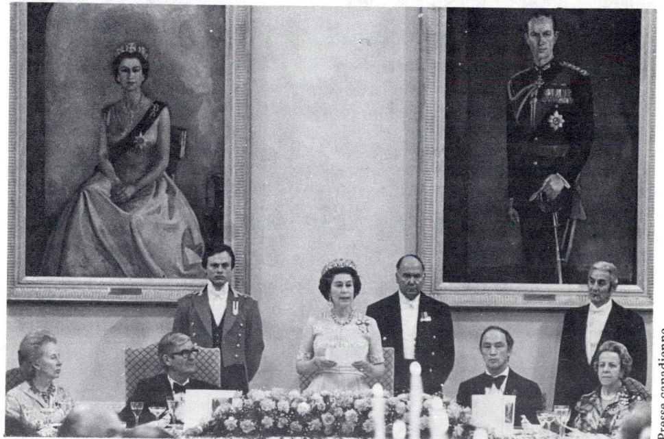
La reine Elizabeth adressant son message à la nation canadienne, au cours d'un dîner d'État à Rideau Hall, le 16 octobre. A droite de la souveraine: le gouverneur général, M. Léger, et Mme Michener (épouse du précédent gouverneur général). A sa gauche: le premier ministre, M. Trudeau, et Mme Léger.

La reine, accompagnée du prince Philip, est arrivée le 14 octobre à Ottawa pour une visite de six jours. Elle a été accueillie par le gouverneur général, M. Léger, et Mme Léger, le premier ministre