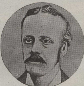
M. ARTHUR JAMES BALFOUR, ex-premier ministre d'Angleterre.

— Quatre prix Nobel sont distribués à l'Académie Royale de Musique, à Stockholm, en Suède. Parmi les bénéficiaires on compte le professeur allemand