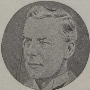
M. JOE CHAMBERLAIN, l'un des figures les plus proéminentes de la politique anglaise actuelle.

— Cinq des ministres du gouvernement russe ont offert leur démission, mais le Tsar refuse de l'accepter.