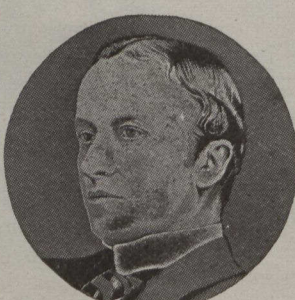
LORD CURZON, ex-vice-roi des Indes Anglaises, qui vient de rentrer en Angleterre.

INTERIEUR — Un grand banquet politique, auquel assistent cinq cents personnes, est donné à l'hôtel Windsor, à Montréal, en l'honneur de l'hon.