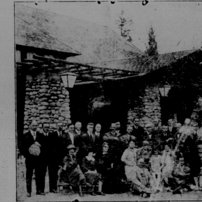
Annonsörerna och abonnentföreningarna... Annonsörerna och abonnentföreningarna...