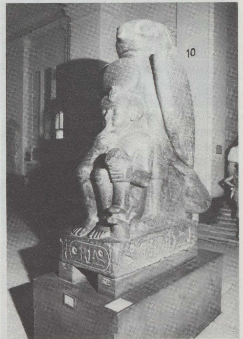
Le dieu Houroun veille sur Ramsès enfant. Faite de granit, de grès et de calcaire, cette statue mesure 2,31 m de haut.