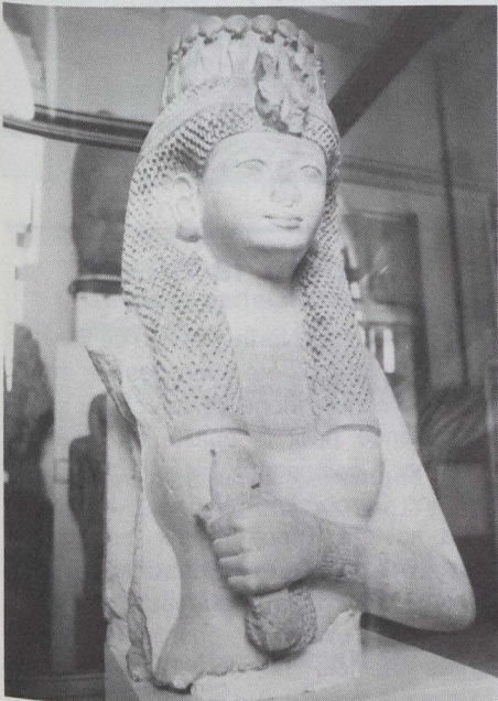
La reine avec menat (collier rituel pharaonique), sculptée dans le calcaire, est considérée comme l'un des chefs-d'œuvre de la statuaire ramsesside.

Montréal nous offre l'Égypte sur un plateau. L'Égypte d'il y a 30 siècles, faite de conquêtes, de temples majestueux; l'Égypte d'un pharaon à dimension divine, Ramsès II. C'est grâce à une exposition intitulée Le Grand pharaon Ramsès II et son temps que depuis le 1 er juin et jusqu'au 29 septembre, nous est permis ce voyage à travers l'histoire. Et cela, au Palais de la civilisation, ancien pavillon de la France à l'Exposition universelle de 1967 qui, devenu édifice à vocation culturelle, est actuellement l'une