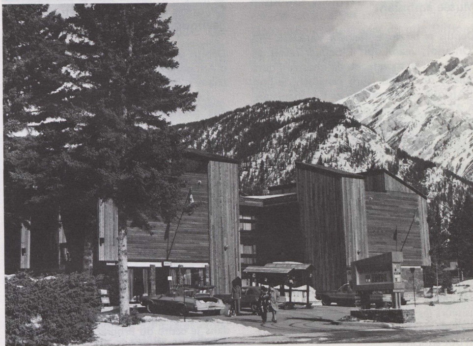
Montagnes aux cimes enneigées dans le parc national de Banff (Alberta).

Banff, Lac Louise et Jasper sont trois joyaux touristiques dont la renommée n'est plus à faire.