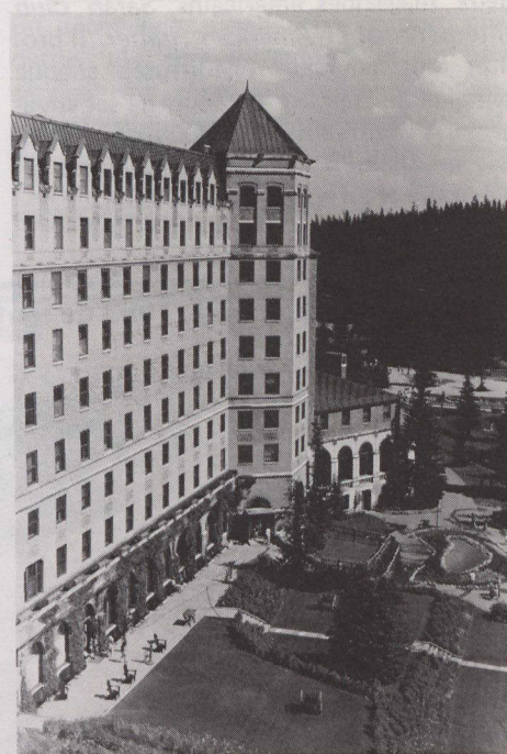
Le Château Lac Louise est situé dans le parc national de Banff (Alberta).

diatement l'image du lac Louise, dont la beauté, quelle que soit la saison, fait la joie des photographes.