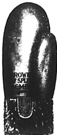
No 730 1

Mitaine doublée, en veau épais fendu brun, poignet en laine, très grande dimension.