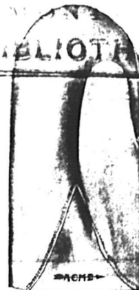
No 713 1

Gant doublé, en veau épais fendu brun, avec agrafe et attache en corde.