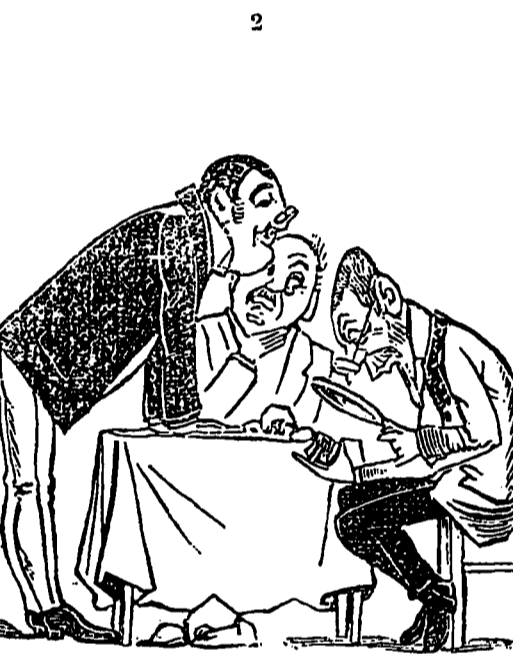
Le conseil d'hygiène déclara que c'était un microbe parfaitement constitué.