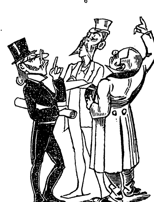
Les autorités scientifiques déclarèrent le lendemain que la disparition de ce cas et l'absorption de ce microbe étaient un phénomène scientifique absolument inexplicable.