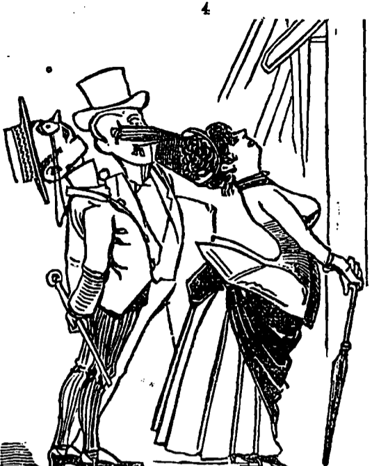
Ce qui étonna beaucoup les passants.