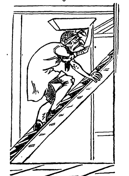
Un honnête placardeur fut envoyé pour coller l'affiche de picote traditionnelle.