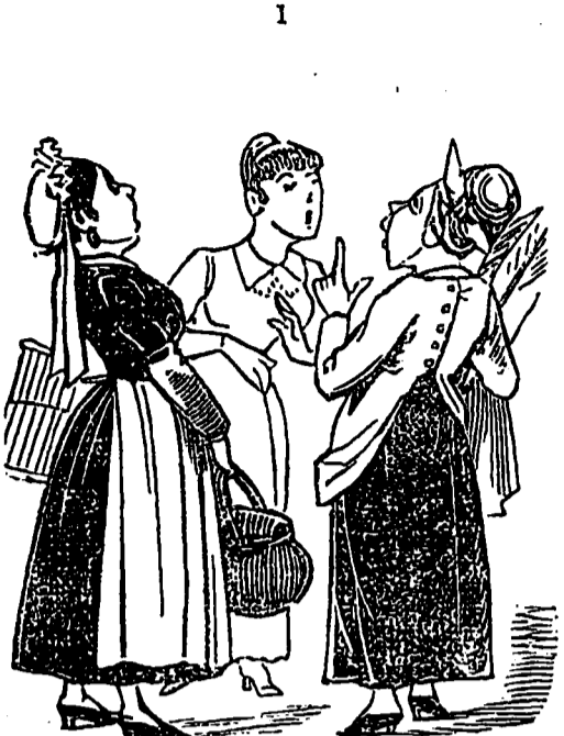
Plusieurs commères du village Saint-Jean-Baptiste se réunirent un matin pour causer entre elles d'un cas extraordinaire. On avait découvert un microbe chez leur voisin Pitauchard dit Picoteux.