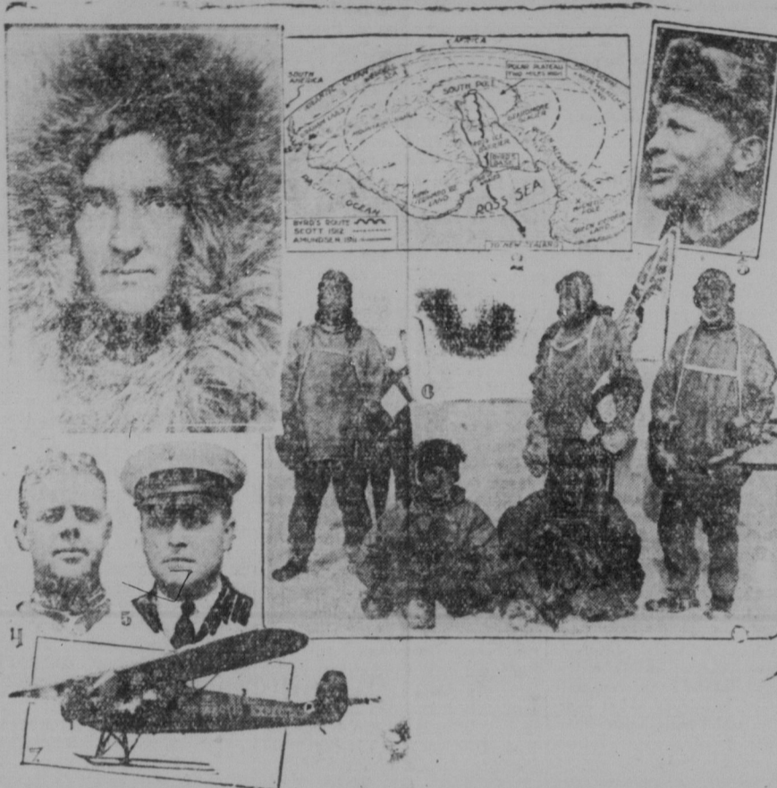
Vi bringa här en del intressanta bilder från Byrds i dagarna fullbordade flygfärd över Sydpolen. 1) Commander Richard Byrd. 2) En karta över expeditionens route med jämförelser över Scotts och Amundsens. 3) Bernt Balchen, den norske piloten. 4) och 5) medlemmar av expeditionen. 6) Vid expeditionens bas å läget vid Bay of Whales. 7) Flygplanet, med vilket expeditionen företog den riskfyllda färd.