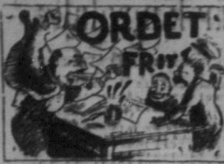
SVENSKA CANADA-TIDNINGENS MÅRSCHE.